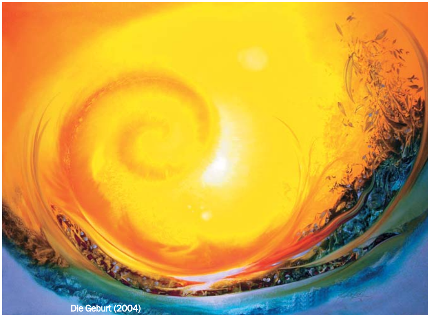
Die Geburt (2004)